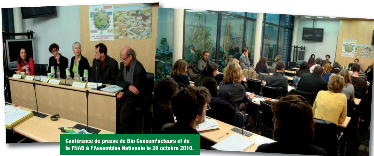
Conférence de presse de Bio Consom'acteurs et de la FNAB à l'Assemblée Nationale le 26 octobre 2010.

Ainsi 75 % des parents et 41 % des actifs souhaitent que la cantine de leurs enfants ou leur restaurant d'entreprise leur propose des menus bio. En 2010, 50 % des établissements scolaires ont proposé des produits bio à leurs menus.